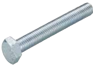
Vite testa esagonale SKS