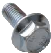
Vite testa esagonale flangiata SKS